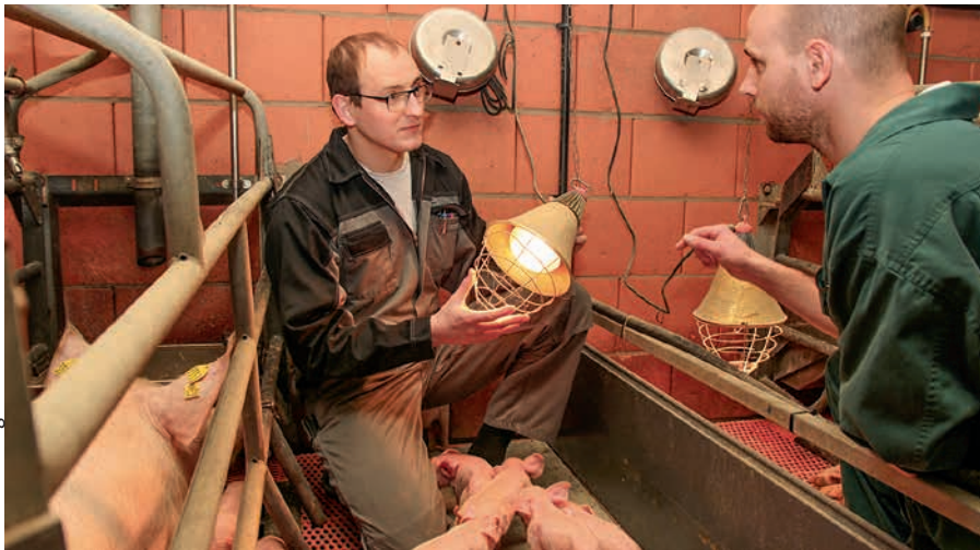
Durch den Austausch der 150 W-Infrarotlampen durch 100 W-Infrarotsparlampen werden in der Anlage knapp 3 500 € pro Jahr an Stromkosten eingespart.

Eine übersichtliche Haupt- und Unterverteilung ist wichtig, um die Messensoren für die Gerätegruppen richtig setzen zu können.