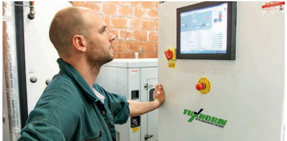
In der Sauenanlage läuft seit zwei Jahren ein Erdgas-BHKW. Seitdem wird der benötigte Strom und die Wärme selbst erzeugt.

Darüber hinaus werden in Abstimmung mit dem Landwirt auch in meh-